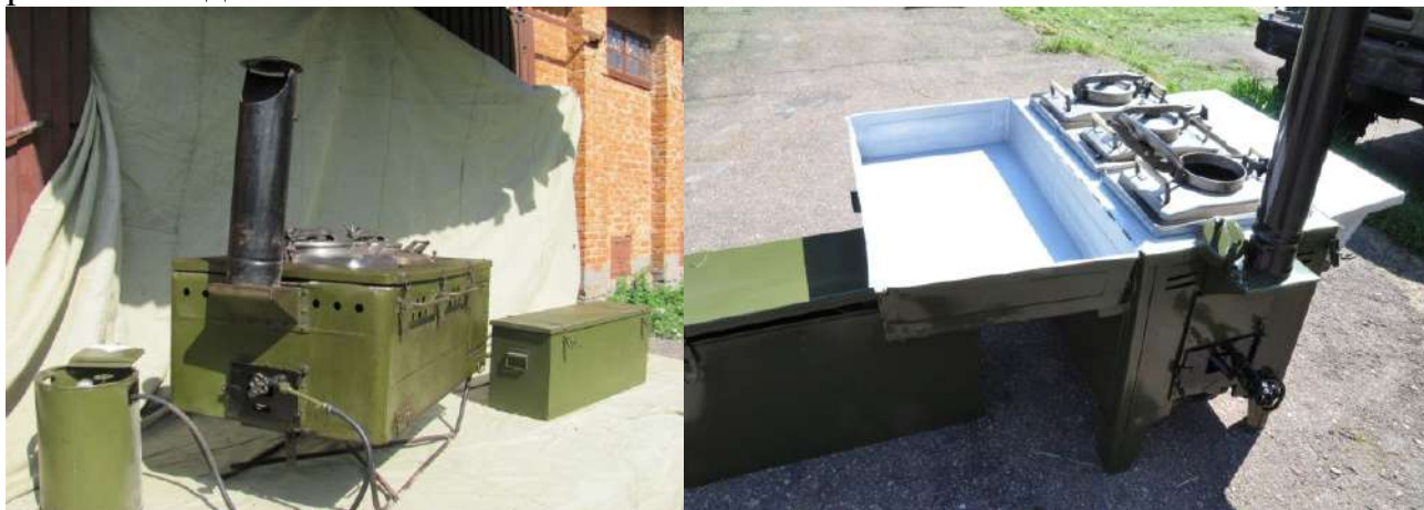
Засоби приготування їжі (район АТО).

У таборах харчування військовослужбовців організовується із польових кухонь. Підрозділи, що не мають власних засобів для приготування їжі, прикріплюються на постачання до підрозділів, які мають ці засоби. Для приготування їжі, видачі хліба, масла коров'ячого, цукру, чаю або окропу для пиття розгортається продовольчий пункт підрозділу і призначається добовий наряд. Готова їжа видається військовослужбовцям тільки в індивідуальні казанки (одноразовий посуд). Офіцери, прапорщики (мічмани) та військовослужбовці-жінки у таборах забезпечуються харчуванням за нормами належного їм продовольчого пайка на продовольчих пунктах своїх підрозділів разом з солдатами.