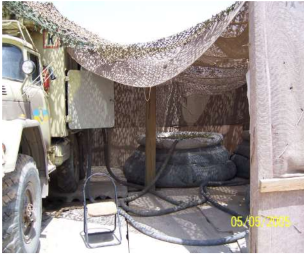
Добуток води за допомогою МАФС (Ірак).

Обладнання пунктів водопостачання здійснюється при можливості з використанням існуючих джерел водопостачання у тому числі і відкритих. При неможливості або відсутності таких джерел, водопостачання здійснюється за допомогою підвозу води у базовий табір.