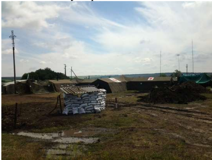
Варіант розміщення мобільного госпіталю (район АТО).

Долікарська медична допомога (з елементами першої лікарської допомоги, при наявності лікаря в підрозділі) надається середнім медичним персоналом на полі бою, в медичному пункті батальйону та батальйонній (ротній) тактичній групі базового табору, не пізніше 1 години з моменту поранення.