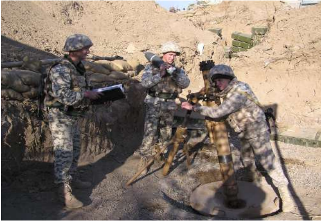
Розміщення мінометного розрахунку (Ірак)

Зона безпеки В (1,5 км – 15 км) – зона часткової безпеки (контролю) ділянка місцевості навколо табору, яка частково контролюється БТГр, але існує можливість, ведення розвідувально-диверсійної діяльності, та здійснення нападів на наші підрозділи. Безпека забезпечується веденням розвідки у взаємодії з органами місцевого самоврядування та правоохоронними органами.