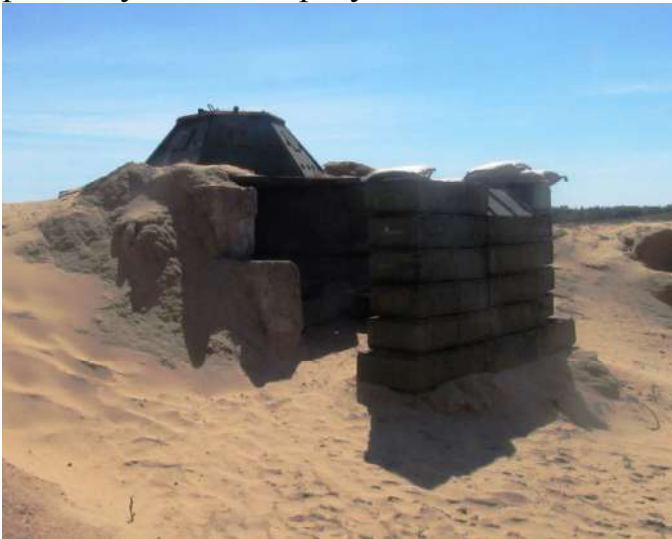
Захищений спостережний пост (239 ЗВП «Новомосковський»)

Вночі у разі надходження доповіді з спостережних постів про підозрілий об'єкт (спрацювання сигнальної міни) черговий штабу визначає місце на карті і дає команду черговому артилерійському розрахунку на освітлення вказаної ділянки місцевості. Наприклад „...Ядро-50, Факел №27, першу освітлювальну міну вогонь”. В цей час спостерігачі постів посилюють пильність та увагу. При виявленні противника застосовується зброя (озброєння) на ураження згідно правил стрільби і управління вогнем артилерії, але виходячи із можливостей. При цьому, кількість чергових засобів подвоюється, один артилерійський розрахунок проводить періодичне або безперервне освітлення місцевості, другий проводить стрільбу на ураження. Відділення управління проводить розвідку цілей і корегування вогнем.