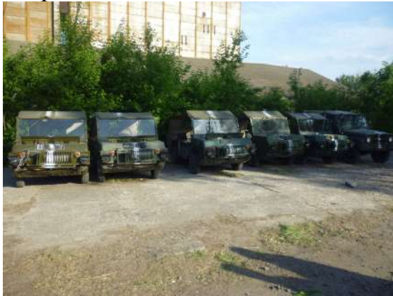
Санітарні транспортери переднього краю (ТПК) (зона АТО).

Для надання медичної допомоги у кожному базовому таборі, відповідно до потреби та з урахуванням функціональних спроможностей медичної служби розгортаються медичні пункти батальйонів (БТГр), мобільні лікарсько-сестринські бригади (далі – МЛСБ), медичні роти (окремі функціональні підрозділи медичних рот) бригад на п'ять – десять ліжко-місць (в залежності від кількості особового складу базового табору) та розгортаються ізолятори для інфекційних хворих (окремі намети на дві інфекції). Організовується цілодобове чергування медичного персоналу з наданням невідкладної та амбулаторної медичної допомоги особовому складу.