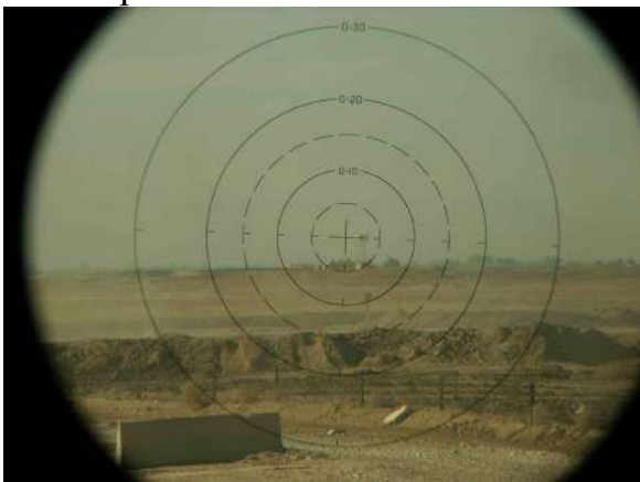
Поле зору труби зенітної командирської (ТЗК)

Вся інформація по розвідці повинна надходити до штабу БТГр, при цьому офіцер, який чергує на вогневій позиції, прослуховує і аналізує інформацію, підвищує пильність в даному секторі. При доповіді з спостережного посту, що у визначеному секторі, біля такого-то орієнтира спостерігається, наприклад, автомобіль з озброєними особами черговий штабу, з дозволу командира БТГр, дає команду на відкриття вогню черговому розрахунку. Чергова зміна артилерійського розрахунку готує установки і здійснює стрільбу. Спостережні пости, на яких розміщені прилади ТЗК, БН-2(1ПН-54), посилюють спостереження.