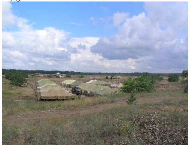
Розміщення приміщень для особового складу у базовому таборі (Ірак та район АТО)

Основними напрямками діяльності командирів щодо створення умов служби і побуту військовослужбовців є: