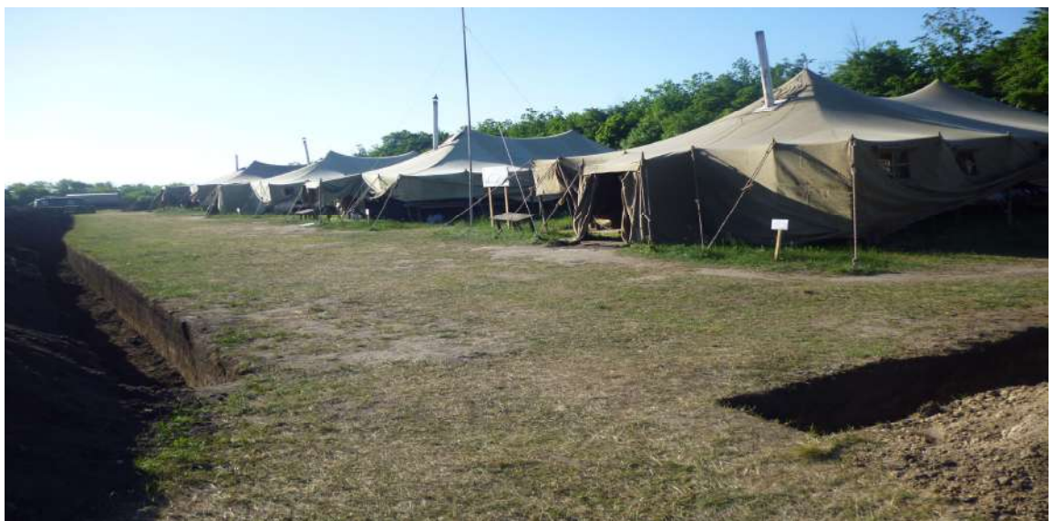
Житлова зона базового табору (район АТО).

ймовірні місця мінування шляхів сполучення та місцевості, вогневих засад противника.