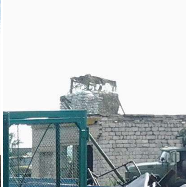
Спостережний пост на будівлі (район АТО)

Спостережні пости обладнуються в місцях, які дозволяють оглядати підступи до базового табору на найбільшій відстані. Їх кількість залежить від тактичних умов місцевості та просторових розмірів базового табору. Спостережні пости забезпечуються: панорамами, на яких позначаються основні та запасні сектори спостереження і стрільби, номери орієнтирів (місцевих предметів та умовні їх назви) та дальність до них, райони особливої уваги та можливі напрямки нападу противника; обов'язками спостерігача на кожен спостережний пост відповідно до завдань; інструкціями про порядок застосування зброї, по заходах безпеки, про порядок зміни спостерігачів; витягами із таблиці сигналів управління та оповіщення; графіками періодичності доповіді про несення служби; сигнальними (освітлювальними) ракетами; оптичними приладами; приладами нічного бачення; засобами радіозв'язку (провідного за можливістю); аерозольними засобами (димами).