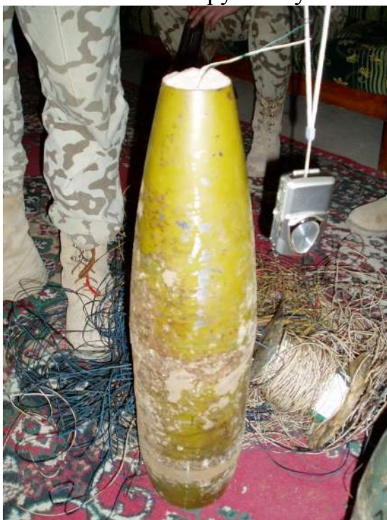
Керований по проводам фугас з 155мм снаряду (Ірак)

Основними завданнями інженерної розвідки при виконанні завдань за призначенням є розвідка шляхів руху під час патрулювання або супроводження конвоїв (щоденне, постійне завдання), яка проводиться з метою перевірки наявності фугасів вздовж маршрутів, на мостах та інших гідротехнічних спорудах, виявлення небезпечних ділянок руху, визначення шляхів обходу, наявності вибухонебезпечних предметів в місцях зупинок або привалів. Проводиться силами інженерно-саперного відділення інженерно-саперного підрозділу, позаштатним інженерно-саперним відділенням, всім особовим складом конвою або патруля візуально під час руху.