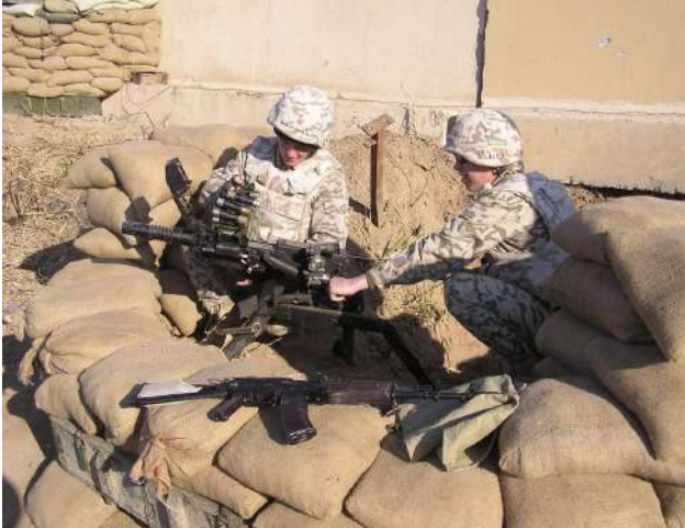
Вогнева позиція АГС - 17 на спостережному посту(Ірак)

штабах БТГр створюються групи вогневого ураження у складі 2-3 офіцерів, спроможних здійснювати планування застосування артилерії, авіації та ППО.