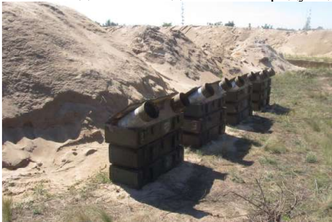
Варіант місця розряджання зброї (239 ЗВП «Ново московський»).

Біля місць загального користування (намети (споруди) для відпочинку, їдальня тощо) обов'язково обладнується місце перевірки на розрядженість зброї. Відповідальність за перевірку зброї, крім особистої, військовослужбовця несе посадова особа добового наряду підрозділу.