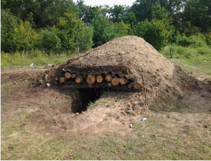
Укриття для особового складу (район АТО)

вогневих позицій противника. У разі виявлення вогневих позицій черговий штабу негайно дає команду черговому артилерійському розрахунку на обстріл вогневих позицій противника. Після закінчення обстрілу черговий штабу дає команду на вільне пересування по території базового табору.