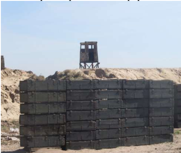
Спостережний пост (район АТО)

спостережні пости (стаціонарні, піші або на транспортних засобах) - для безпосередньої охорони периметру базового табору, забезпечення командира оперативною інформацією щодо обстановки навколо табору;