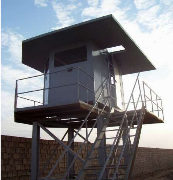
Спостережний пост (Ірак)