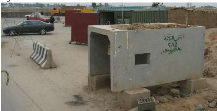
Обладнання вогневої точки (Ірак).

Для обладнання вогневих точок найбільш доцільно використовувати бетонні конструкції, з обладнанням у них бійниць для забезпечення розміщення кулеметника.