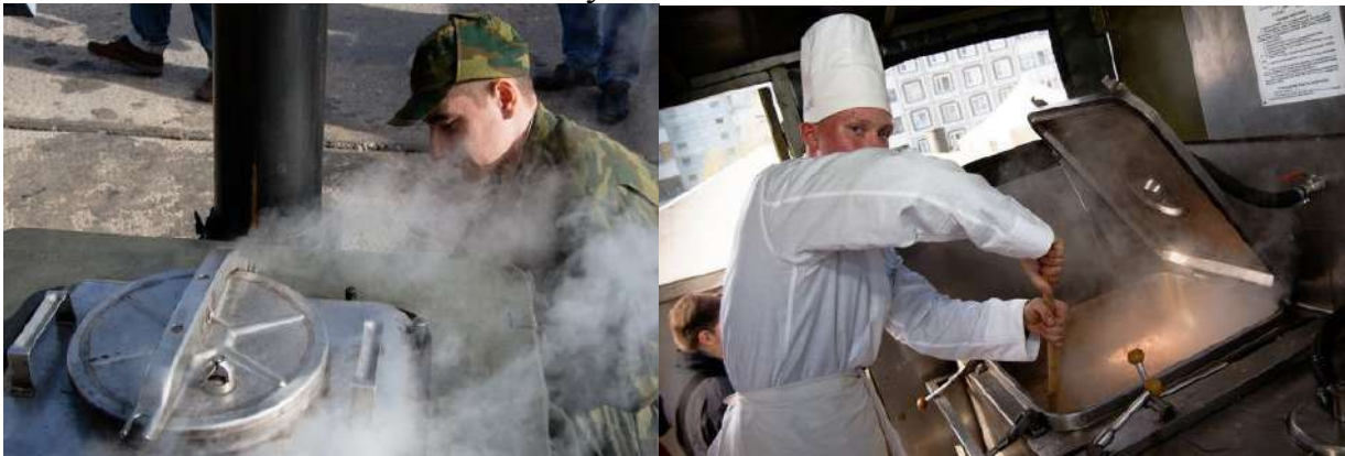
Приготування їжі у базовому таборі (район АТО)

У визначений розпорядком дня час начальник пункту продовольчого забезпечення дає дозвіл на видачу їжі.