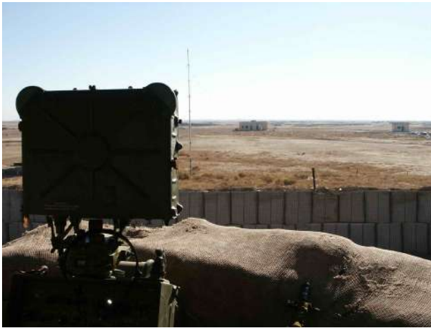
Станція ближньої розвідки СБР-3 на спостережному посту (Ірак).

спостережні пости, які обладнуються приладами ТЗР (СБР-3, ПСНР-5, РСА 1К18 "Реалія", МРСА "Табун"). Для ведення спостереження за допомогою ТЗР, можливо залучення особового складу розвідувальних підрозділів з розрахунку на кожний засіб - 2 чоловіки на добу. Крім того, ТЗР може використовуватися на КПП.