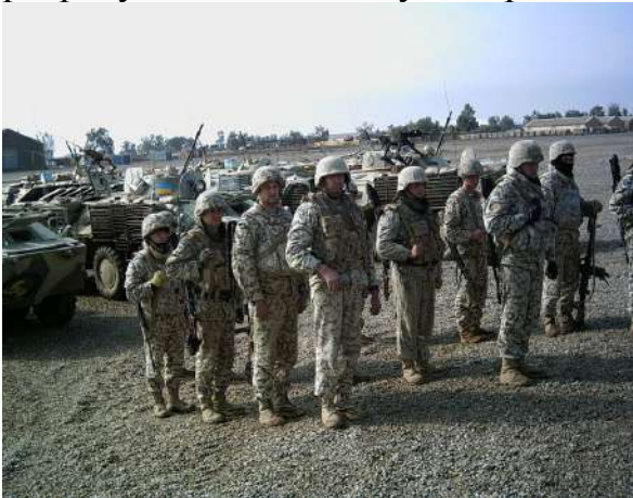
Підготовка підрозділу охорони (Ірак)

До охорони і оборони базових таборів, як правило, залучається підрозділ зі своїм штатним командиром, засобами посилення (артилерійські розрахунки, розрахунки ППО, обслуги керованих мінних полів та інші).