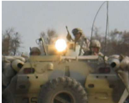
«Філіни» спостерігають (Ірак)

Це дозволяє попереджувати застосування противником саморобних вибухових пристроїв, заздалегідь виявляти підготовлені вогневі засідки.