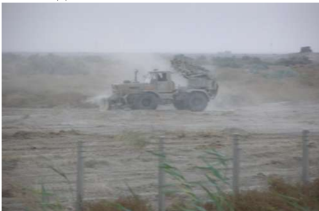
Розчистка ділянки під елемент базового табору

Інженерні підрозділи організують та здійснюють: розчищення під'їзних доріг, майданчиків для розташування особового складу та техніки, секторів спостереження навколо табору, облаштування найбільш небезпечних напрямків мінно-вибухових та невибухових загороджень, сигнальних мін, обвалування (обладнання) периметру табору, надають допомогу у створенні захисних масок від спостереження та прямого вогню противника, проводять видобуток та очищення води.