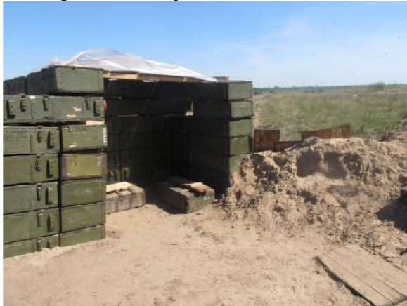
Вогнева позиція з ящиків з піском (базовий табір 239 ЗВП «Новомоськовський»)

З метою попередження несанкціонованого перетину межі табору всіма видами транспорту та людьми, недопущення завезення (перенесення) вибухових (вибухонебезпечних) речовин, зброї та боєприпасів при в'їзді в базові табори обладнуються КПП.