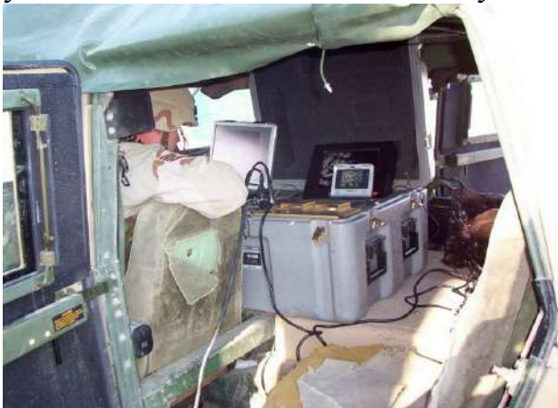
Елементи обладнання зв'язку у базовому таборі (Ірак).

Перевірка стану засобів зв'язку та їх роботи повинна проводитись як мінімум два рази на добу, щоб виключити можливість виходу їх з ладу, а головне, надати можливість залишити підрозділ без зв'язку, на постах потрібно мати резервні радіостанції та батареї до них. Особливо це стосується віддалених об'єктів. Для ведення переговорів по засобах зв'язку, розробляється спеціальна переговорна таблиця, в котрій передбачаються кодовані назви не тільки для підрозділів, техніки, а і назви завдань, які виконуються. Крім всіх згаданих заходів, не треба забувати про підготовку запасних частот, які повинні бути узгоджені з вищестоящим командуванням.