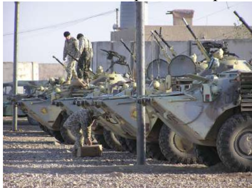
Парк бойових машин

Адміністративна зона: штабні приміщення, вузол зв'язку.