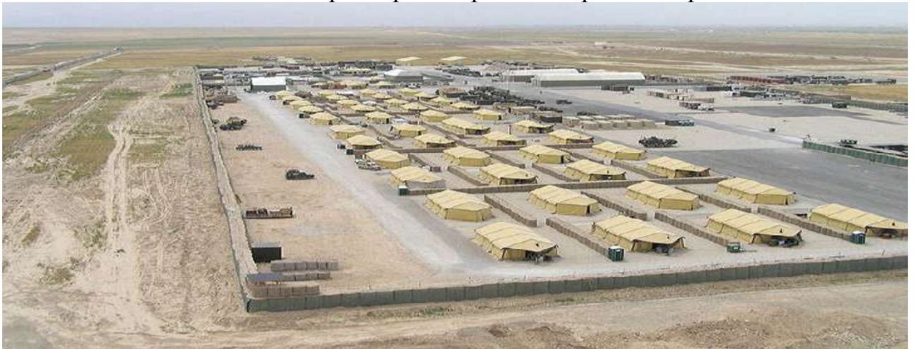
Варіант базового табору (Ірак).

Базовий табір – спеціально відведена ділянка місцевості де розташовані один або декілька підрозділів (військових частин), які розміщуються в наметових містечках (спорудах), на стоянках озброєння і військової техніки, складах, вогневих позиціях артилерії та протиповітряної оборони.