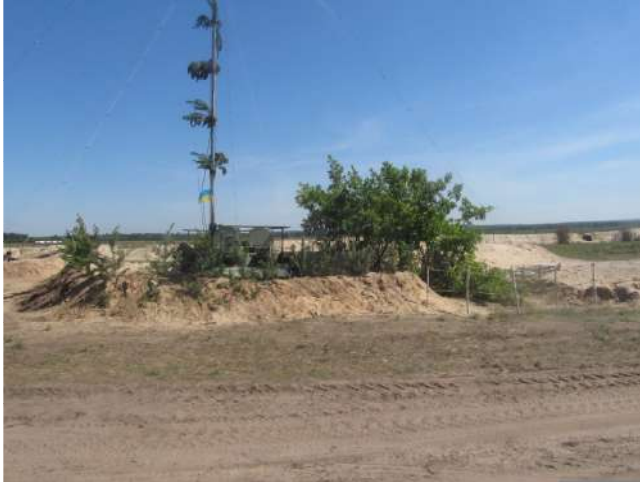
Командно-штабна машина Р-145 «Чайка» в укритті

базового табору, обладнують вертолітний майданчик.