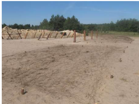
Невибухові інженерні загородження навколо базового табору

На найбільш небезпечних ділянках проводиться ешелонування невибухових загороджень. При цьому відстань між рядами загороджень повинна бути не більше 50 м.