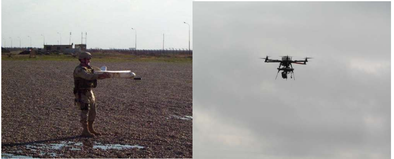
Проведення розвідки в зонах безпеки базового табору (Ірак та район АТО)

Розвідка з використанням БПЛА створює умови для передачі і отримання інформації до штабу БТГр (РТГр) в реальному масштабі часу та високу вірогідність своєчасної реалізації отриманих розвідувальних даних.