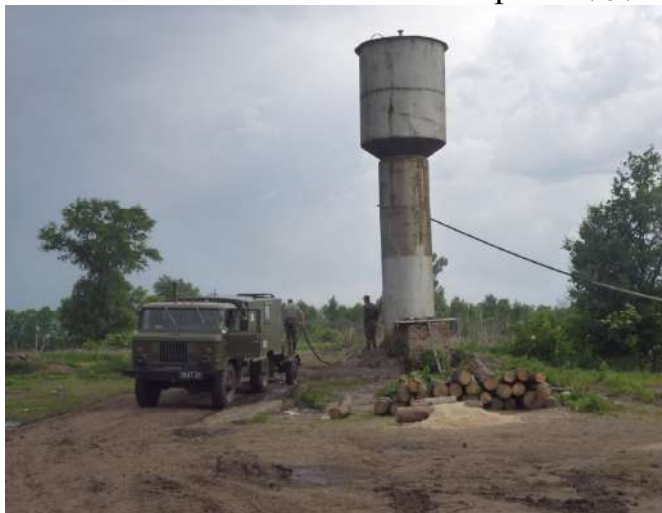
Забезпечення особового складу питною водою (район АТО).

Забороняється видача м'ясних порцій без повторної теплової обробки. Зберігання готової їжі допускається в термосах протягом не більше 2 годин, після чого вона повинна повторно піддаватися тепловій обробці.