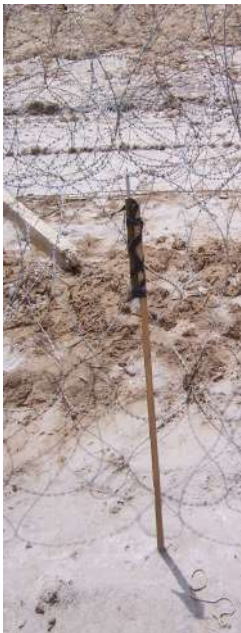
Сигнальна міна СМ (Ірак)

Для своєчасного виявлення противника з прихованих напрямків місцевості, у тому числі і вдень можуть, виставляються секрети і встановлюються сигнальні міни.