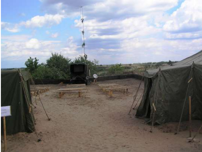
Розгорнутий польовий автоклуб на базі ПАК - 66

Одночасно, вказана співпраця передбачає для командира БТГр можливість більш детально вивчити місцевість, де розташований ввірений йому підрозділ, що значно розширює спектр можливих варіантів при плануванні та організації заходів щодо виконання підрозділом завдань за призначенням, більш ефектively організації заходів охорони та оборони території табору, збереження життя і здоров'я військовослужбовців, виключення можливості втрати зброї, боєприпасів, військової техніки та майна.