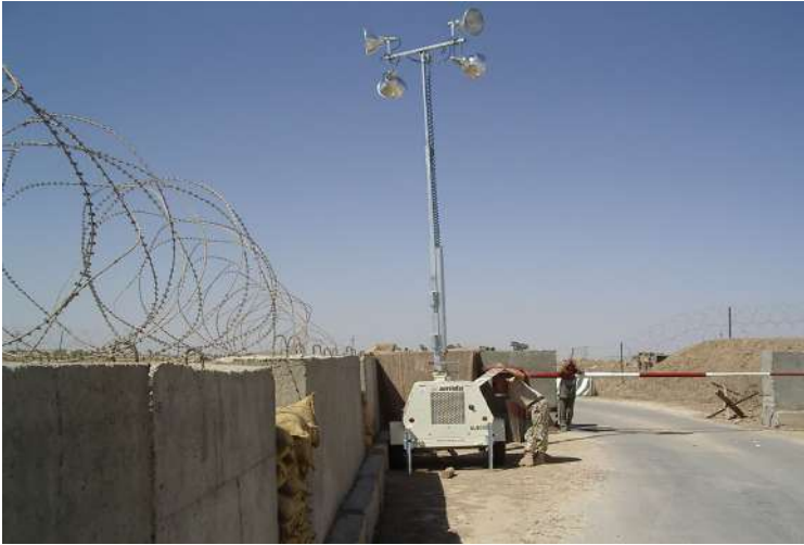
Дизельна освітлювальна станція (Ірак)

З метою введення противника в оману щодо кількості та режиму спостереження, виставляються манекени (чучела), обладнуються хибні спостережні пости, створюються на підступах до меж базового табору хибні ділянки мінно-вибухових загороджень (позначених на місцевості відповідними покажчиками, залишення на місцевості штатної укупорки від інженерних боєприпасів, встановлення навчальних інженерних боєприпасів та інше).