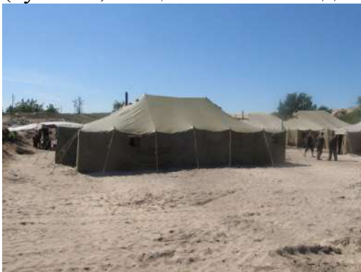
Житлова зона БТГр на 239 ЗВП «Новомосковський»

Житлова зона: місце для відпочинку та приймання їжі офіцерським складом, місце для відпочинку та приймання їжі особового складу (сержанти, солдати), місця для миття особового складу та прання білизни, медичний пункт (шпиталь), місця для заняття спортом та морально-психологічного розвантаження особового складу, об'єкти забезпечення життєдіяльності (туалети, місце вивезення відходів), місця для проведення занять.