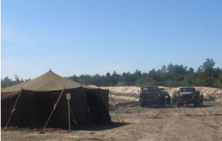
Пункт заправки техніки (239 ЗВП «Новомосковський»)

У базовому таборі машини заправляються паливом, як правило, штатно-табельними засобами підрозділів.