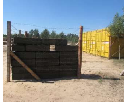
Охорона та розміщення складу РАО (район АТО).