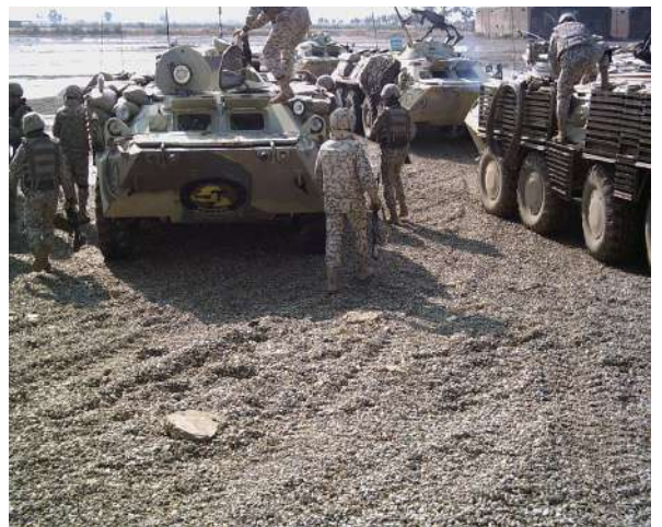
Тренування підрозділів охорони (Ірак)

Під час несення служби, спостерігачі на спостережних пунктах відповідно до завдання, уважно спостерігають за місцевістю і зміною обстановки у визначених секторах та періодично, відповідно графіку, доповідають про стан служби старшому сектору. Старші секторів, в свою чергу доповідають командирі підрозділу, від якого призначена охорона, а командир підрозділу – черговому штабу.