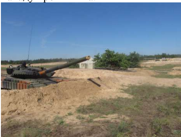
Танк на вогневій позиції по охороні базового табору.

Підрозділи охорони висуваються на визначені рубежі, організовують допуск на територію базового табору, систему спостереження і вогню, готують маршрути висування та розгортання резервних груп для відбиття раптового нападу противника.