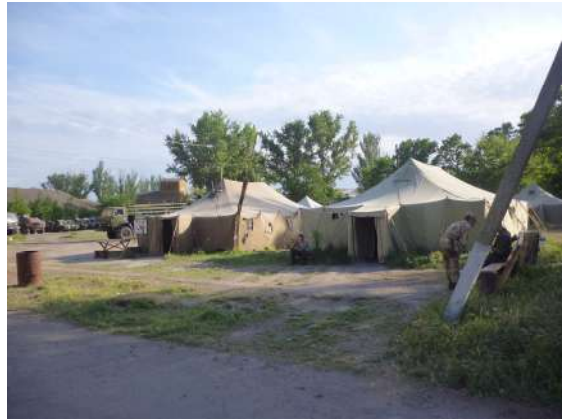
Розміщення особового складу (район АТО)

У зимову пору року намети повинні бути утеплені з допомогою піднаметів. Для утеплення підлоги при відсутності дерев'яних щитів, використовують лапник, при цьому його шар повинен бути не менше 20-30 см. Зовні навколо намету для захисту від вітру роблять валики зі снігу. У всіх наметах встановлюються печі. Крім того, для просушки обмундирування та взуття обладнується окремий намет на підрозділ.