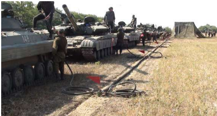
Проведення заправки бойової техніки у польових умовах (район АТО).

Автоцистерни, автопаливозаправники і вантажні автомобілі з паливом в тарі розташовуються з урахуванням умов маскування і таких відстаней: між машинами 10-15 м; між відділеннями машин 20-30 м; між взводами 50-100 м.