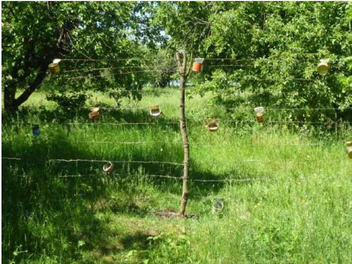
Старий «дідівський» спосіб сигналізації (район АТО).

У разі нападу значних сил противника на базовий табір до його оборони залучається весь особовий склад, що перебуває в ньому. Підрозділи займають визначені смуги оборони, позиції, рубежі, наносять вогневе ураження усіма засобами та відбивають атаку противника. При сприятливих умовах мобільний резерв здійснює маневр у фланг чи тил противника та рішучою атакою (з вогневого рубежу) знищує його у взаємодії з авіацією СВ.