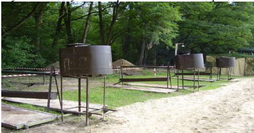
Обладнання умивальників особового складу (район АТО).

У зимову пору року намети повинні бути утеплені з допомогою піднаметів. Для утеплення підлоги при відсутності дерев'яних щитів, використовують лапник, при цьому його шар повинен бути не менше 20-30 см. Зовні навколо намету для захисту від вітру роблять валики зі снігу. У всіх наметах встановлюються печі. Крім того, для просушки обмундирування та взуття обладнується окремий намет на підрозділ.