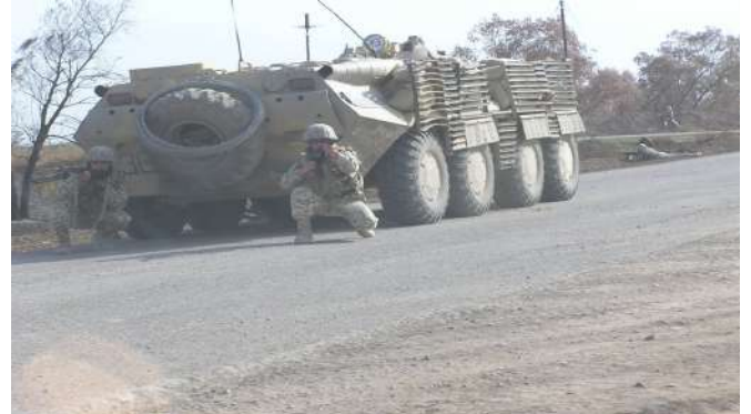
Дії особового складу під час відбиття нападу (Ірак).