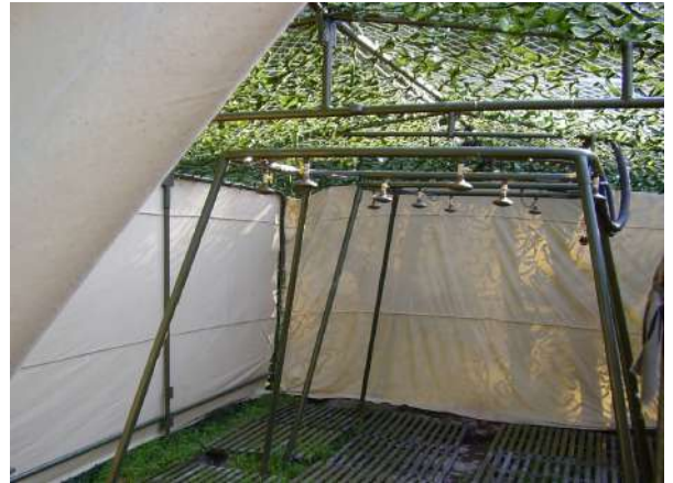
Розміщення лазні (район АТО).

Військовослужбовці повинні митися у лазні не рідше одного разу на тиждень. Кухарі і пекарі, крім того, щоденно приймають душ. Механіки-водії (водії), інші військовослужбовці, робота яких пов'язана з експлуатацією та обслуговуванням озброєння, бойової та іншої техніки, приймають душ у разі потреби (по можливості).